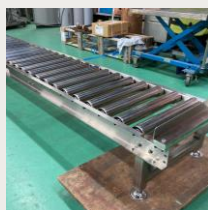
ローラーコンベア