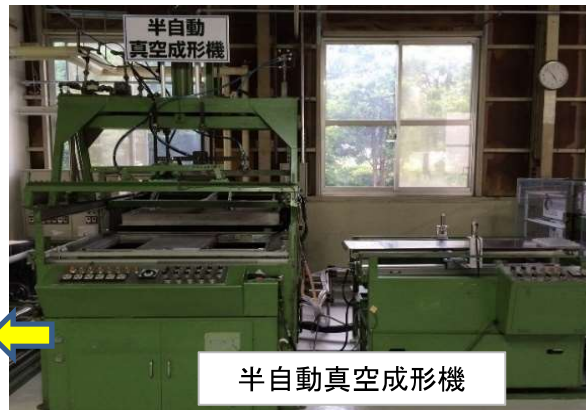
半自動真空成形機