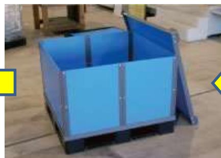
⑤組立上がりの状態