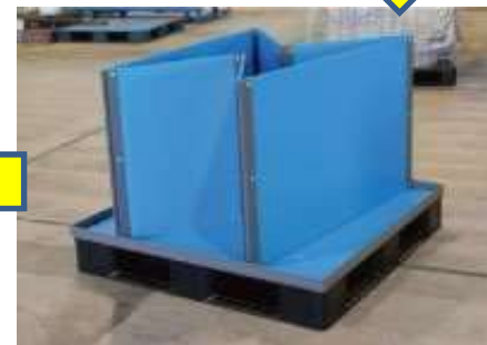
⑥側面を四隅に立てる