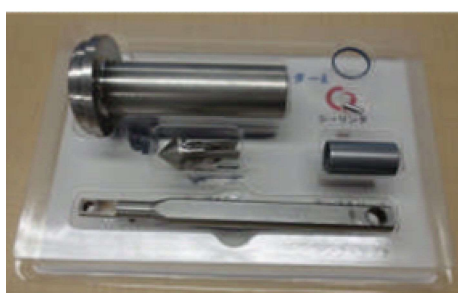
産業用機器ピッキングトレイ