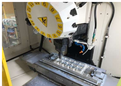
CNC機 computerized numerical control 2019年6月導入