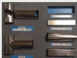
発泡クッショントレイを使用