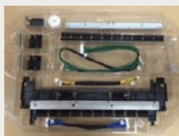
真空成形トレイに置き換え ・製品形状に沿ったポケット ・透明性を利用した写真活用 ・非使用時の収納性が良い