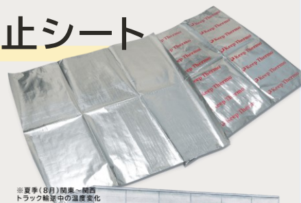
※夏季(8月)関東-関西 トラック輸送中の温度変化

優れた反射率で放射熱をしっかりとカット！ 温度差のリスクが少なく、 貨物の保護に最適です。